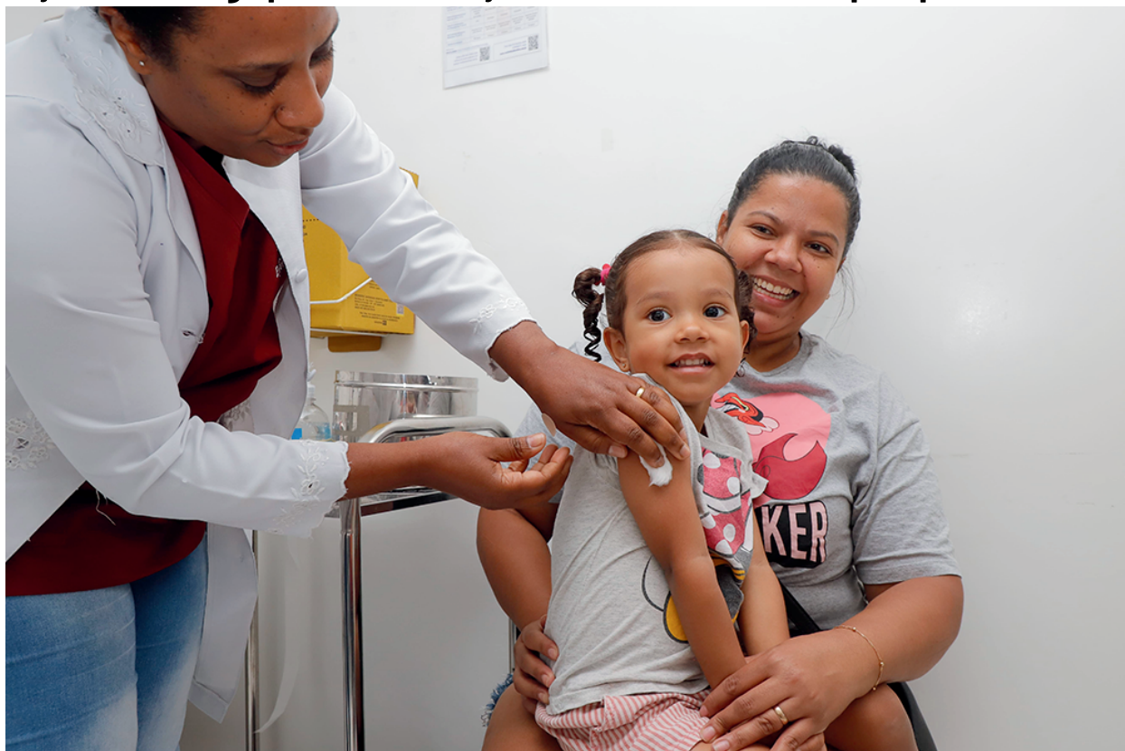
A campanha foca na influenza para grupos prioritários e atualização da carteirinha

No Parque Municipal Dom José, a vacinação acontecerá no dia 24 de maio de 2026, das 9h às 17h. O espaço está lo-