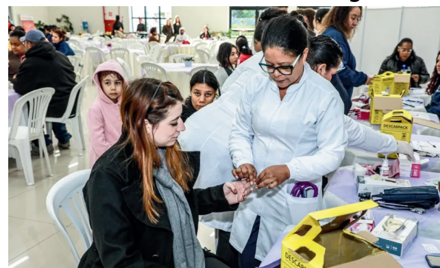
Programa Mãe Parnaibana reúne gestantes em ação de cuidado e orientação

Durante o encontro, as participantes assistiram a palestras sobre saúde neonatal e primeiros socorros, além de passarem por exames clínicos rápidos. O programa tem como objetivo garantir mais segurança, informação e qualidade de vida às gestantes, fortalecendo o acompanhamento pré-natal e o vínculo com os serviços de saúde do município.