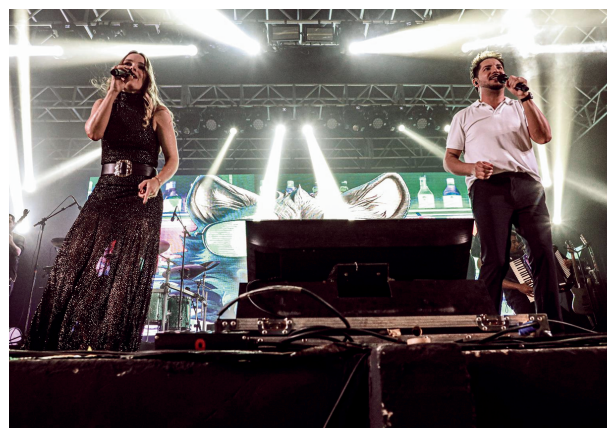
Show de Thaeme & Thiago arrecada recursos para ações sociais na cidade

Um show beneficente da dupla Thaeme & Thiago reuniu cerca de 1,1 mil pessoas em Santana de Parnaíba, com o objetivo de arrecadar recursos para as ações sociais da Comunidade de Amor Rainha da Paz. O evento foi realizado na sede do Futebol Clube Ska Brasil e contou com um repertório de grandes sucessos do sertanejo universitário.