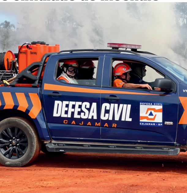
Capacitação teve como objetivo aprimorar técnicas de prevenção e respostas rápidas

Equipes da Defesa Civil Municipal de Cajamar participaram, de um curso e simulado de emergência para incêndios em vegetação realizado em Franco da Rocha. A capacitação teve como objetivo aprimorar técnicas de prevenção, combate e resposta rápida em ocorrências florestais, fortalecendo a atuação dos agentes em situações de emergência e ampliando