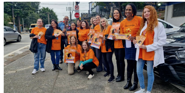
Cajamar reforça conscientização e combate ao abuso infantil com ação do Maio Laranja

cipais. Durante a ação, equipes distribuíram materiais informativos e orientaram a população sobre a importância do combate à violência sexual infantil e da denúncia de casos suspeitos. A campanha reforça a mobilização na proteção dos direitos das crianças e adolescentes, destacando o Disque 100.