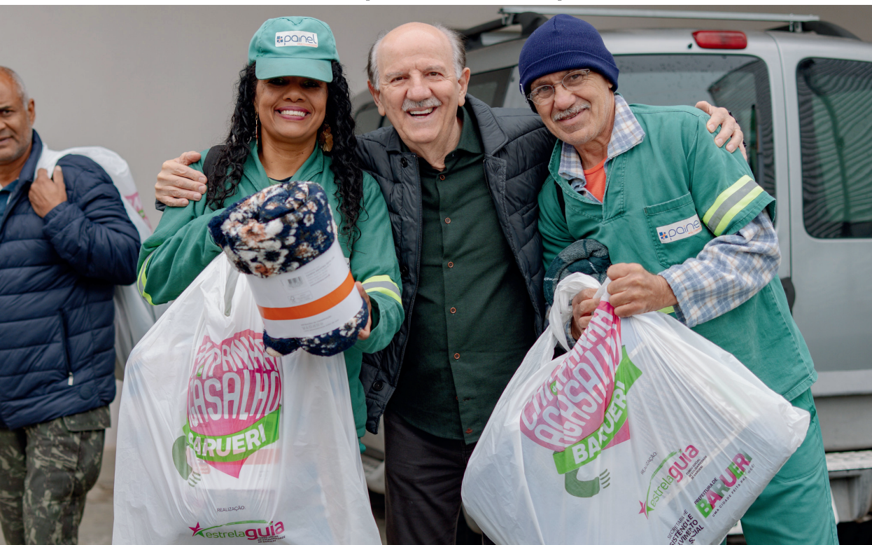
O prefeito de Barueri, Beto Piteri, segue levando acolhimento e solidariedade às famílias da cidade com a entrega de cobertores, mantas e agasalhos

Prefeito de Barueri inicia campanha solidária para levar cobertores, mantas e agasalhos às famílias da cidade