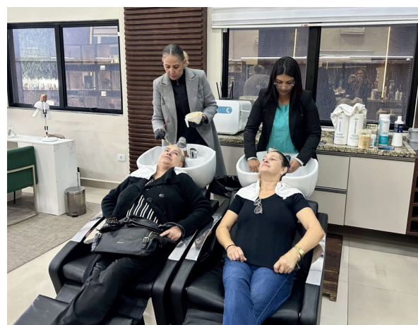
Evento proporcionou um dia de cuidado, autoestima, bem-estar e acolhimento

O Fundo Social de Solidariedade de Cajamar realizou mais uma edição especial do projeto Dia de Beleza de Ester em homenagem ao Dia das Mães. O evento aconteceu no espaço Bears Cave Concept e foi preparado especialmente para mulheres com mais de 60 anos, proporcionando momentos de acolhimento, cuidado, integração e valorização da autoestima.