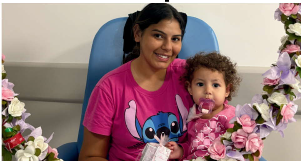
Iniciativas celebraram a data com gestos de afeto, valorização e cuidado dentro do ambiente hospitalar em Santana de Parnaíba

A programação também destacou a ação "Legado de Amor", que compartilhou histórias emocionantes de maternidade vividas pelas colaboradoras do hospital. As iniciativas reforçaram o compromisso do Hospital Santa Ana com a humanização, o acolhimento e a valorização de pacientes e profissionais. As ações foram marcadas por momentos de emoção e reconhecimento.