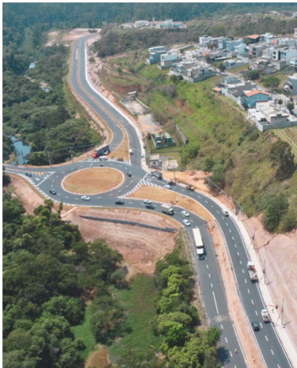
Obra faz parte do projeto que ligará o Polvilho à Via Anhanguera

A obra segue a todo vapor para a conclusão das próximas etapas. A nova via de acesso terá 3,4 km de extensão e tem como objetivo promover melhorias na mobilidade urbana, oferecendo mais uma alternativa para se deslocar entre os bairros e também para acessar a Rodovia Anhanguera, desafogando o intenso fluxo de veículos da Av. Tenente Marques.