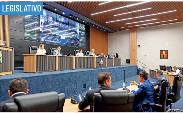
LEGISLATIVO Câmara de Barueri aprova orçamento municipal de R$ 5 bilhões para 2024 • PAG 6