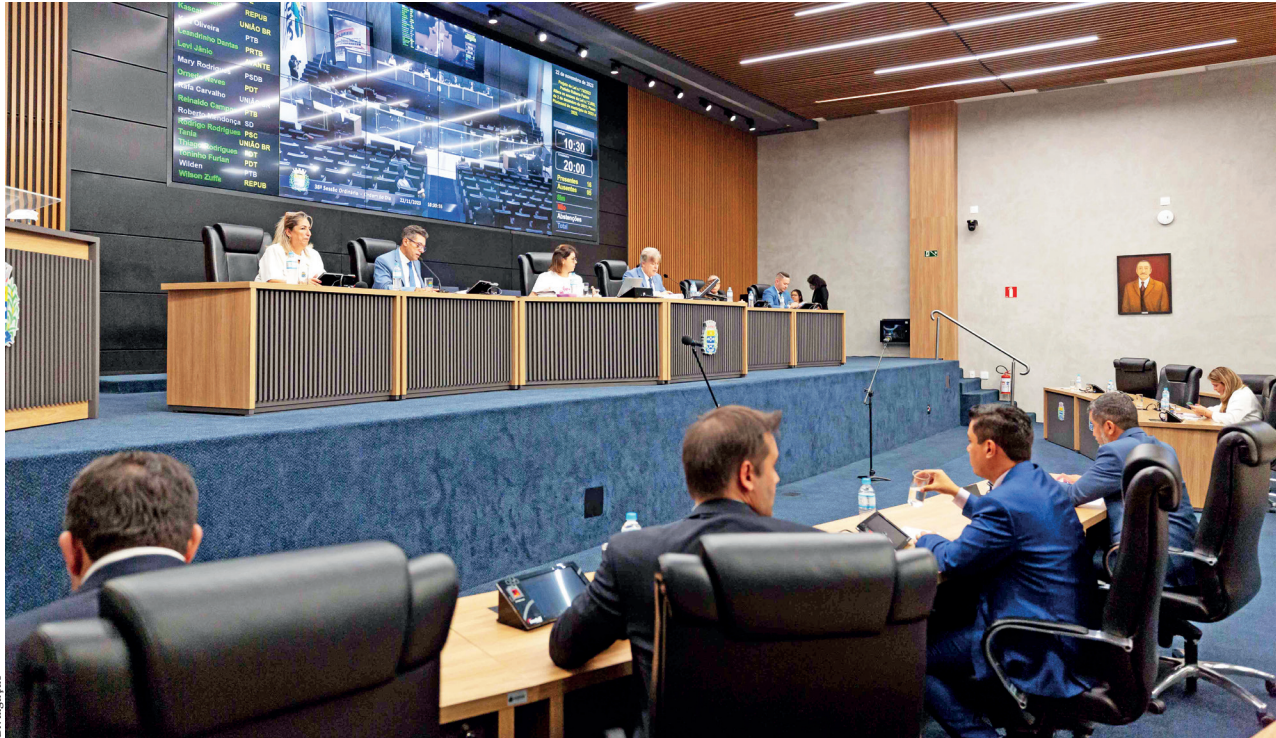
Vereadores de Barueri aprovaram o Projeto de Lei 71/2023, que trata do orçamento municipal para 2024

A previsão apresentada pelo Poder Executivo é de arrecadar mais de R$ 5 bilhões, incluindo o orçamento do Ipresb (Instituto de Previdência Social dos Servidores Municipais de Barueri). Antes de entrar