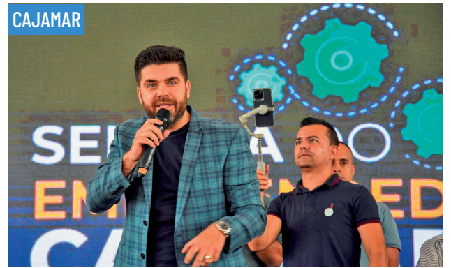
CAJAMAR Prefeito fomenta empregos com Semana do Empreendedorismo • PAG 3