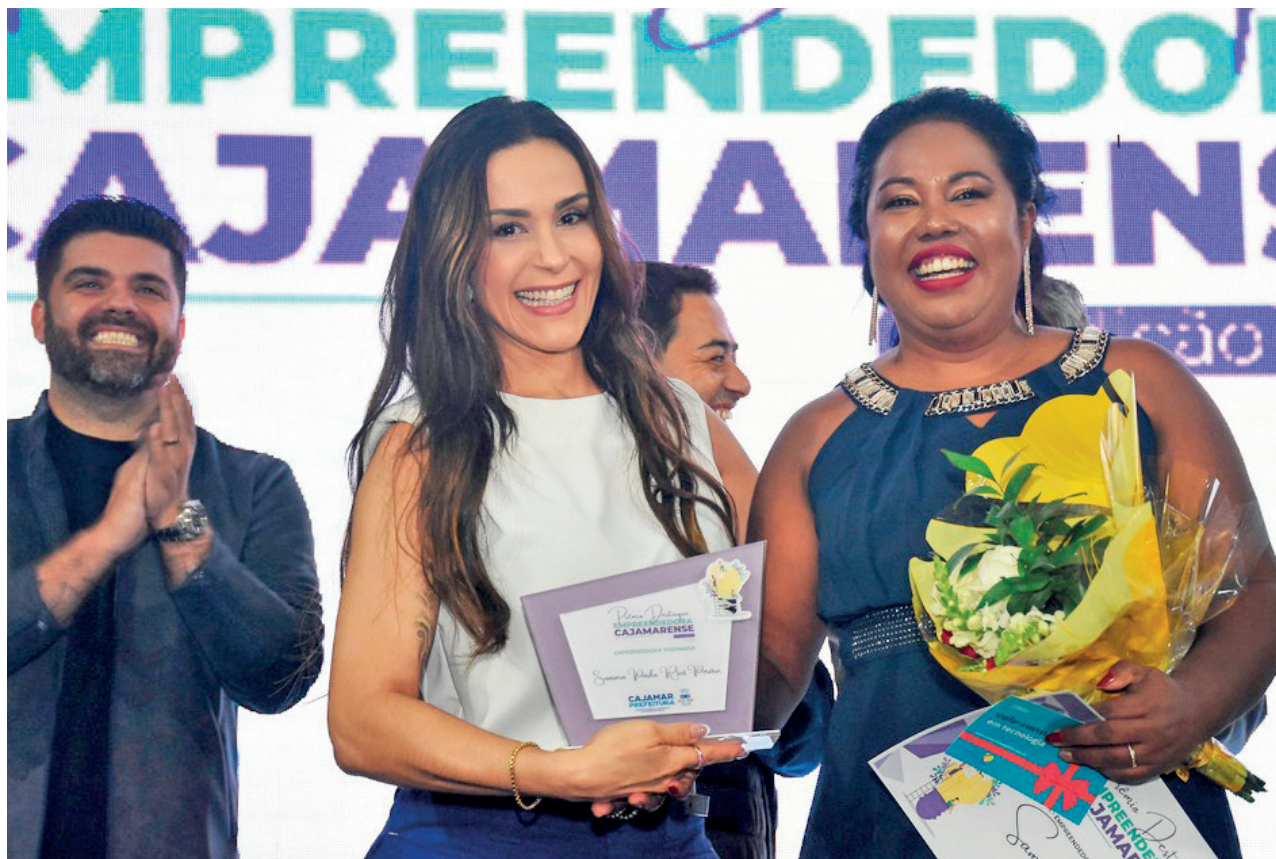
BARUERI • PAG 5

Prefeito e primeira-dama de Cajamar homenagearam as mulheres que se destacaram no empreendedorismo • PAG 3