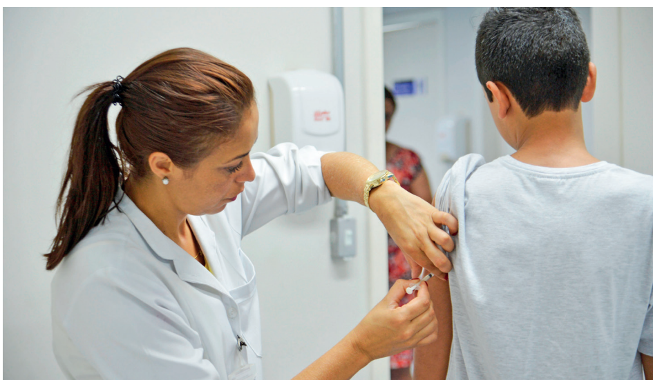
UBS's de Cajamar estão aplicando a dose de reforço contra a febre amarela

A Prefeitura de Cajamar, através da Secretaria de Saúde, convocou a população para tomar a dose de reforço contra a febre amarela. A campanha, que visa fortalecer a imunização da comunidade, será realizada em todas as unidades de saúde que possuem salas de vacinação, de segunda à sexta-feira, das 8h às 15h.